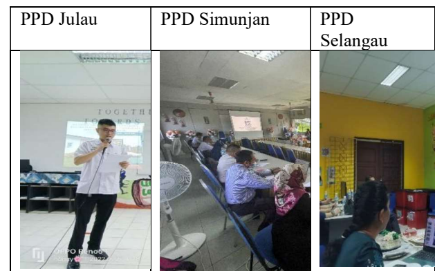
JADUAL 3: SEMASA MENJALANKAN KAJIAN DI PPD MASING MASING PADA JULAI 2022

Gambar di bawah merupakan gambar Pengkaji telah menjalankan penerangan kepada pegawai PPD pada bulan Julai-Ogos 2022.