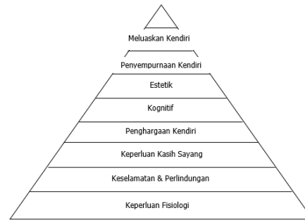
RAJAH 1: PIRAMID TEORI HEIRARKI KEPERLUAN MASLOW

Apabila seseorang individu telah memenuhi heirarki-heirarki di atas, maka individu tersebut telah berjaya memenuhi kesempurnaan sendiri. Maksudnya seseorang itu perlu memenuhi keperluan asasnya terlebih dahulu sebelum bermotivasi mendapatkan satu lagi tahap yang lebih tinggi. Berdasarkan teori Maslow, terdapat lapan hierarki keperluan yang perlu dipenuhi seseorang individu bagi mencapai ke tahap kesempurnaan diri. Teori Hierarki Keperluan Maslow adalah seperti dalam Rajah 1: