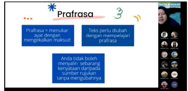
Rajah 9: Penerangan Kaedah Membuat Prafrasa Di Dalam Bengkel Plagiarisme